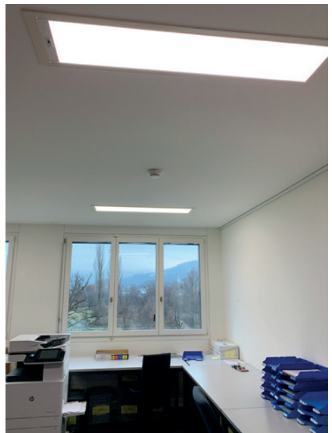
Deckeneinbauleuchte nach dem Umbau