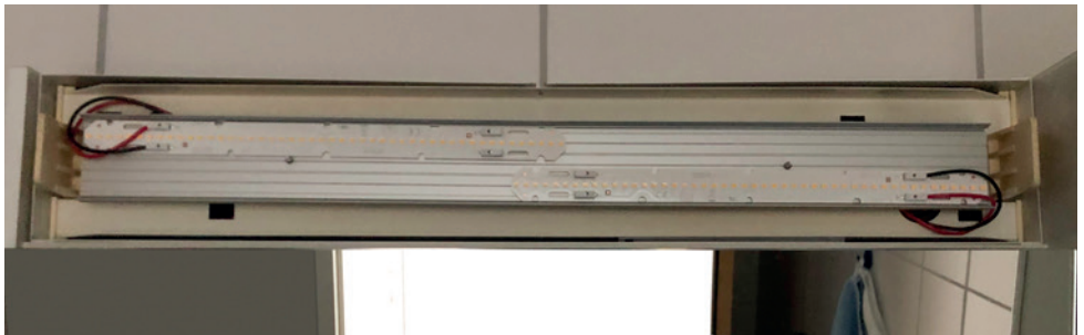
Spiegelleuchte nach dem Umbau