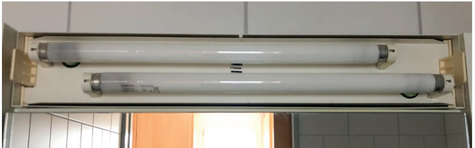
Spiegelleuchte vor dem Umbau