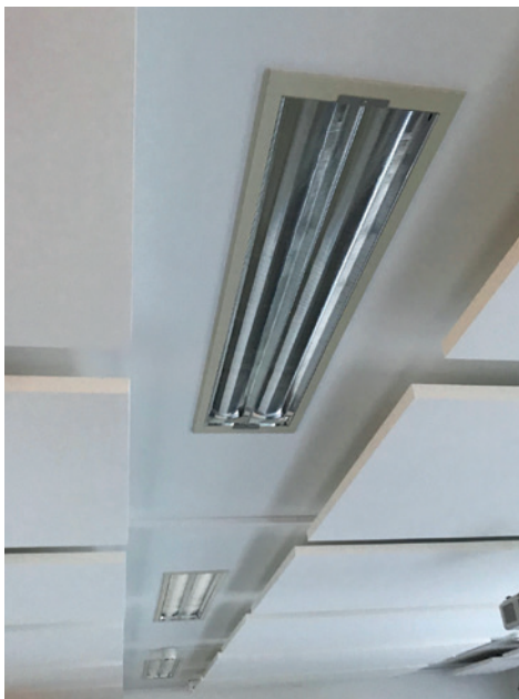
Deckeneinbauleuchte vor dem Umbau

Bei Ihnen sind noch alte FL-Röhren, Hallenstrahler oder Korridorleuchten im Einsatz, die Sie ersetzen möchten? Nehmen Sie mit uns Kontakt auf, wir bieten kundenspezifische Umrüstsätze oder LED-Strahler für einen Austausch.